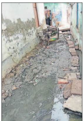
लहरतारा की नई बस्ती की इस गली से गुजरना खतरों से खेलने से कम नहीं।

बारिश में तो समस्या बहुत गंभीर हो जाती है, लेकिन इस मौसम में भी सीवर समस्या कम नहीं है। स्थानीय निवासी गलियों के बीच ईटें रखकर किसी तरह आवागमन कर रहे हैं। सुबह शाम घंटों गलियों में सीवेज बहने के कारण महिलाओं, बुजुर्गों को ज्यादा समस्या हो रही है। यहां रहने वालों के लिए जीवन नारकीय हो गया है। दुर्गाध और गंगाई इन लोगों की दिनचर्या के लिए