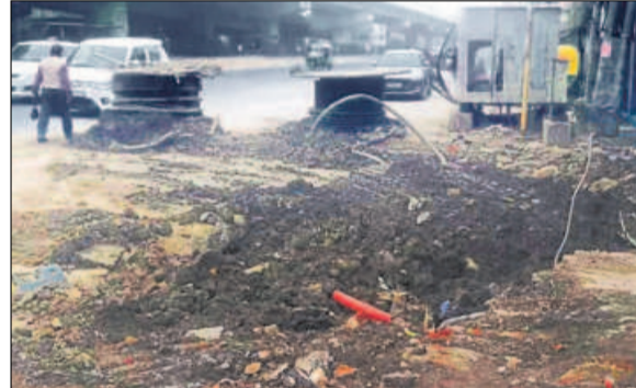
चौकाघाट-कैंट मार्ग पर बिजली विभाग की ओर से खोदा गया गड्ढा भरा नहीं गया है। हाईटेशन केबल भी ऊपर की ओर निकला है, जो हादसे को दावत दे रहा है।